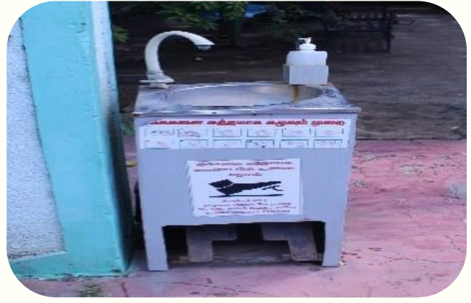
வடிவமைக்கப்பட்ட கைகழுவும் தொட்டி

தற்சார்பு, உளவியல்சார்ந்த புத்தகங்களை கற்றும் இணையத்தளங்களை பார்வையிட்டும் அவ் எண்ணங்களையும் கருத்துக்களையும் தன்னுடைய வர்த்தக நடவடிக்கையில் பிரயோகப்படுத்துகின்றார் அதாவது தனது வெற்றிக்கு "நீ என்னவாக வரவேண்டும் என்கின்ற எண்ணமே உங்களுடைய வாழ்க்கை" என்ற ஒரு புத்தக கூற்றே இவருடைய முன்னேற்றத்திற்கு காரணம் என்று பெருமையாக கூறுகின்றார்..