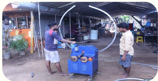
சிறுவர் பூங்கா தயாரிப்புக்கள்