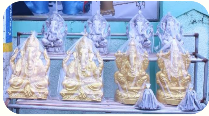
மோல்ட் பண்ணப்பட்ட உருவச்சிலைகள்